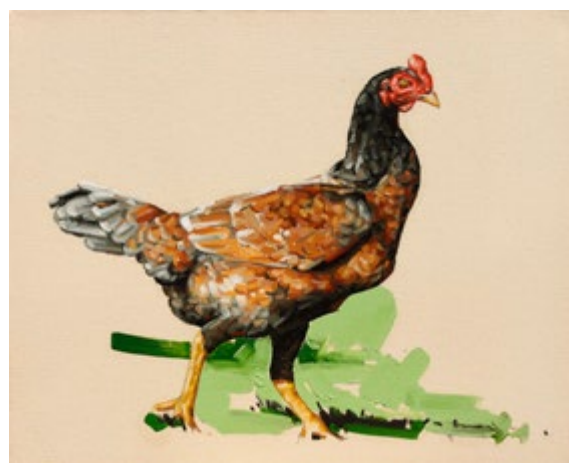
Lourdinha. Óleo sobre tela 48x60cm 2013

O percurso pictórico de Fábio Baroli se desenvolve entre lembranças, histórias, paisagens e trocadilhos. Deitei para repousar e ele mexeu comigo: pinturas de Fábio Baroli é a primeira exposição individual do artista em Brasília, cidade onde ele começou a sua trajetória profissional.