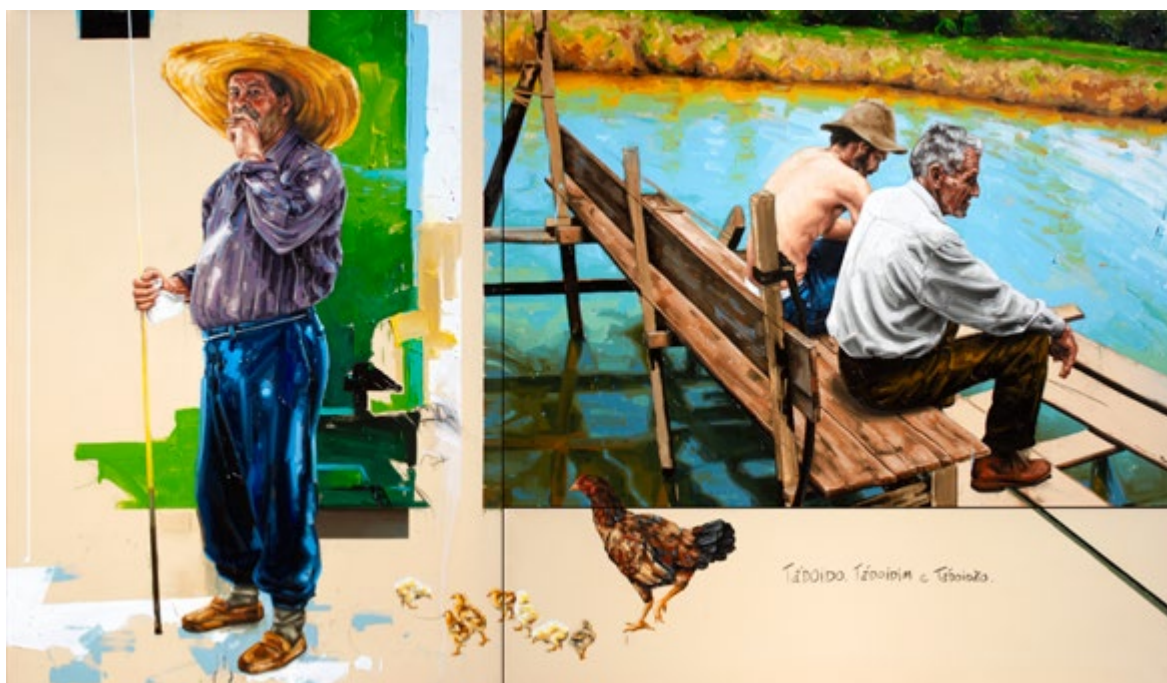
Meu Matuto Predileto. Óleo sobre tela 150x260 (tríptico) 2013