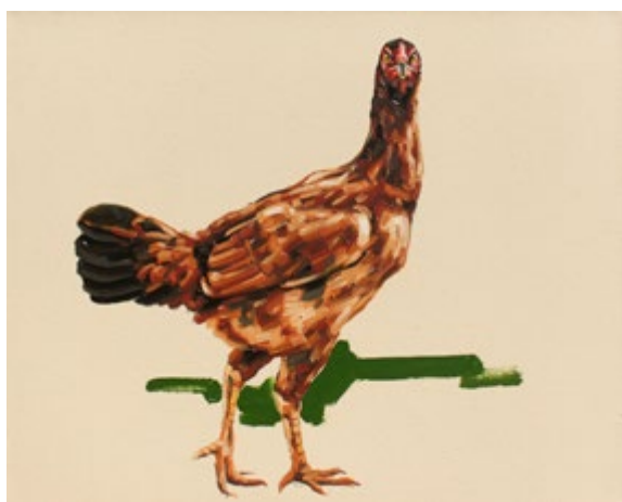
Chris. Óleo sobre tela 48x60cm 2014