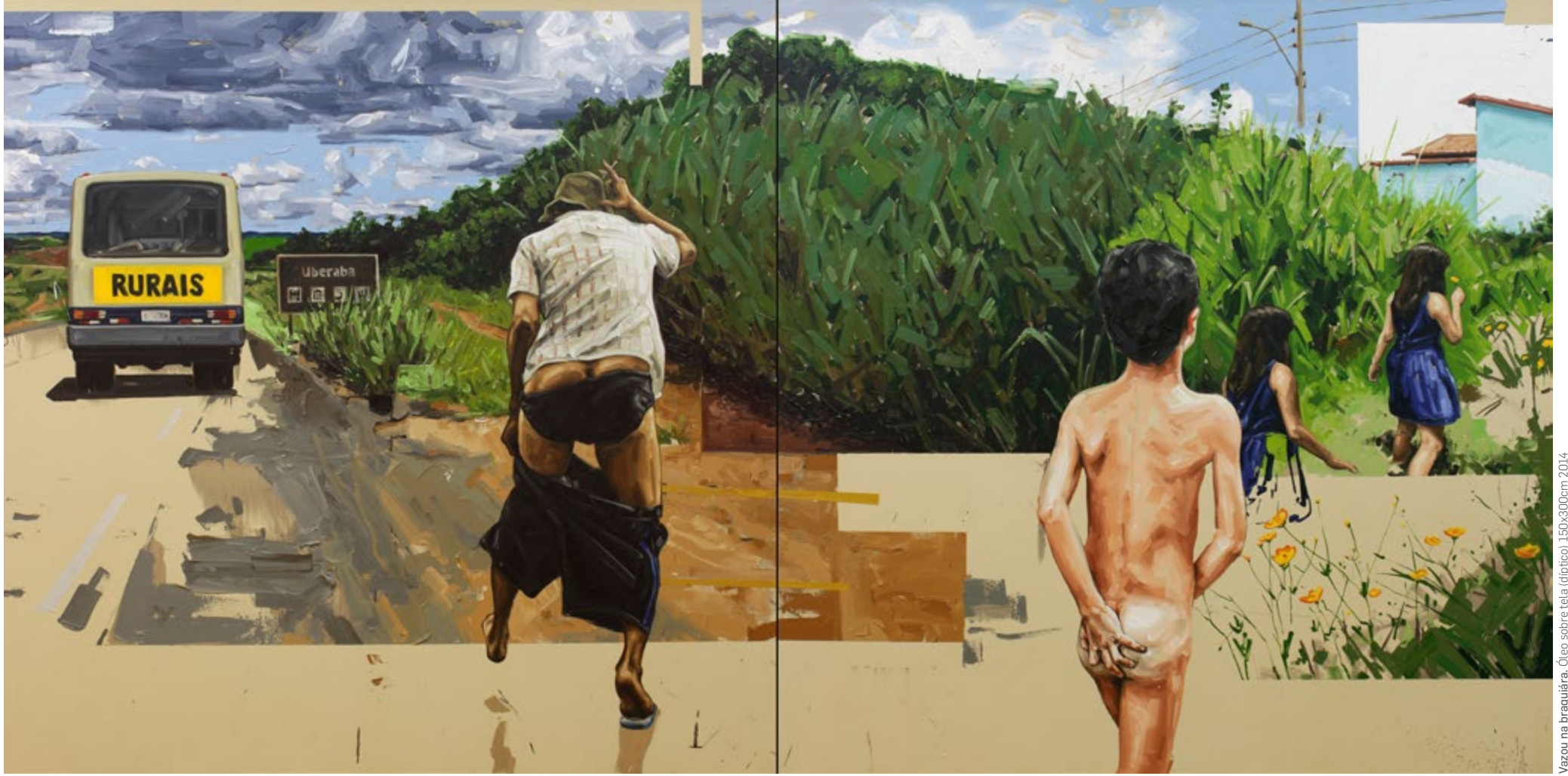
Vazou na braquiária. Óleo sobre tela (diptico) 150x300cm 2014