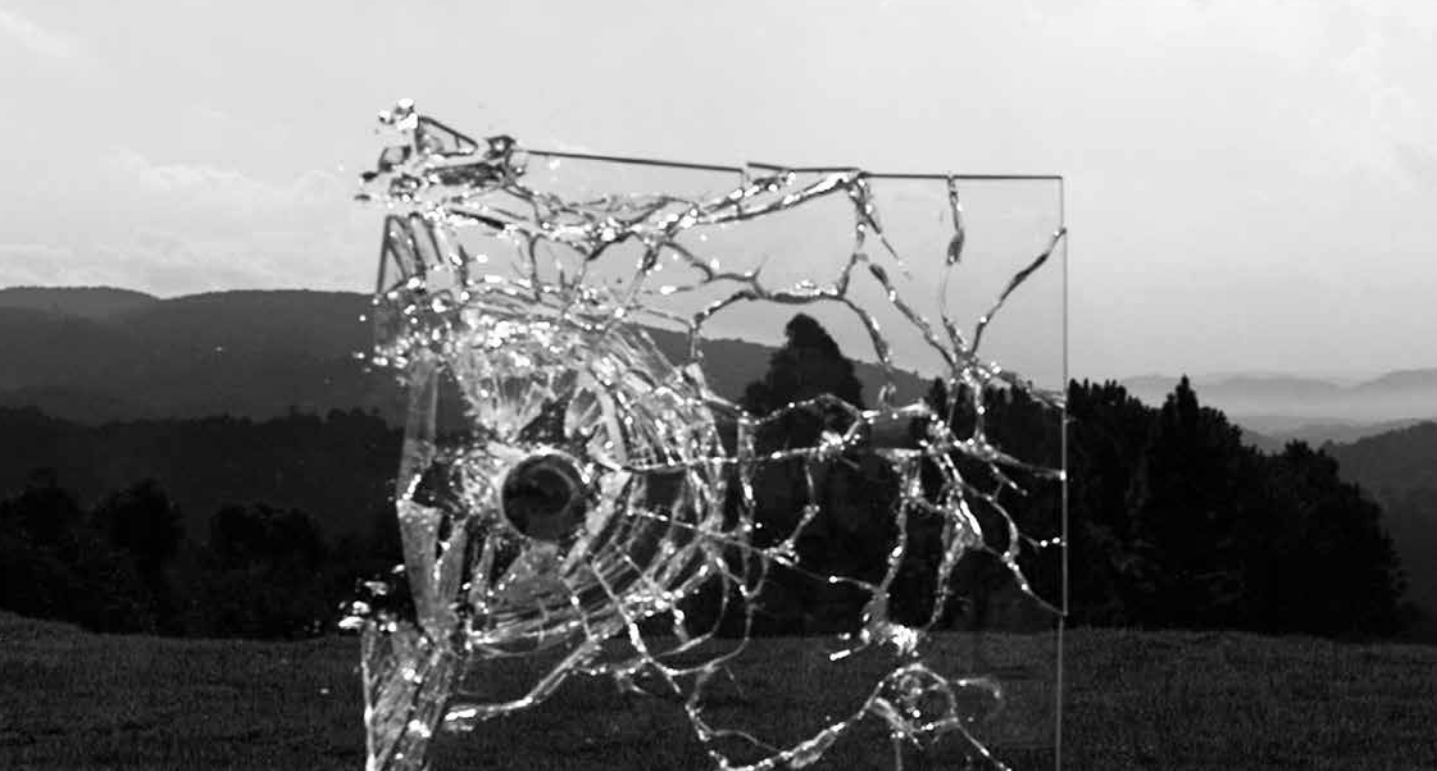
Luiz Roque, Geometria Descritiva , 2012, vídeo, loop Frame de vídeo (tela)

a narrativa de futuro, exercício crítico permanente do artista. São na verdade exercícios de proposição de futuros possíveis, mas que hoje, em termos reais e construtivos (simbólica e materialmente) se mostram inviáveis. Além das condições técnicas ou geopolíticas, existe uma lógica que é colocada no nível do absurdo, na mesma medida em que são escancaradas as mais incríveis incongruências de um espaço quase ficcional, como as paisagens encontradas em São Paulo, cidade em que o artista atualmente reside.