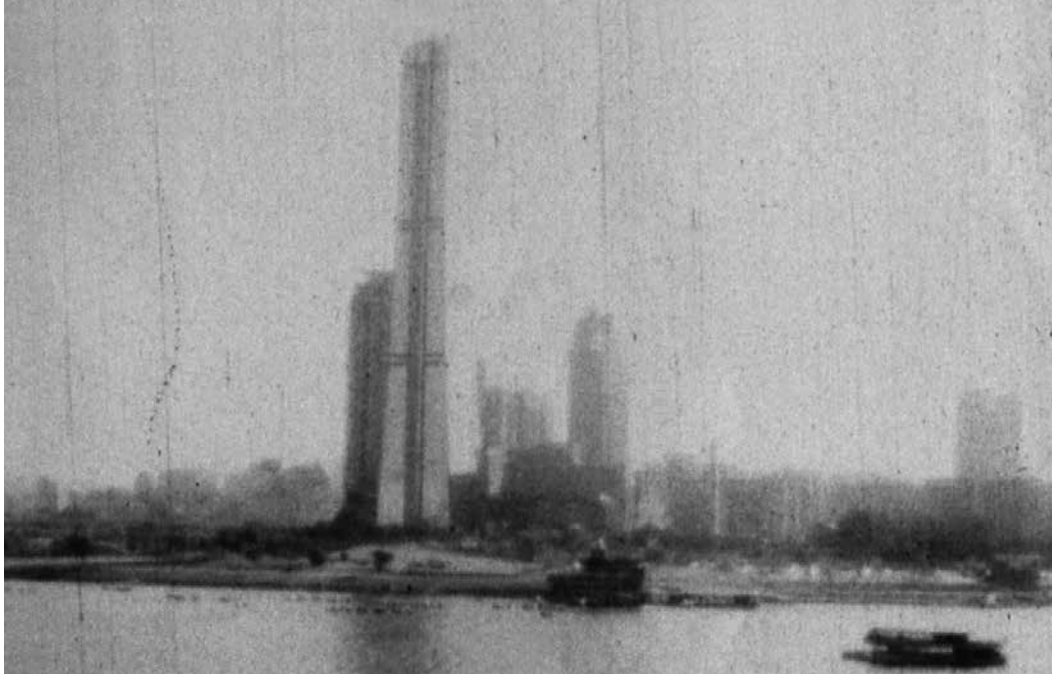
Luiz Roque, The Golden Tower (Torre Dourada), 2012; ampliação fotográfica a partir de filme positivo superoito

adversa e em contato físico e sensorial com o objeto edificado, perceber ali elementos que analogamente nos remetem à ordem dos conflitos interpessoais nos espaços urbanos.